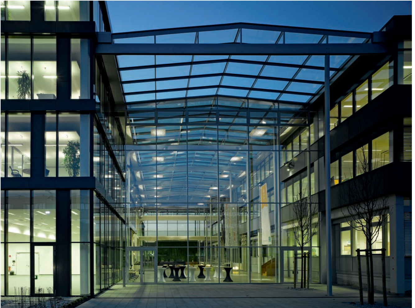
Bechtle AG – Konzernzentrale, Atrium