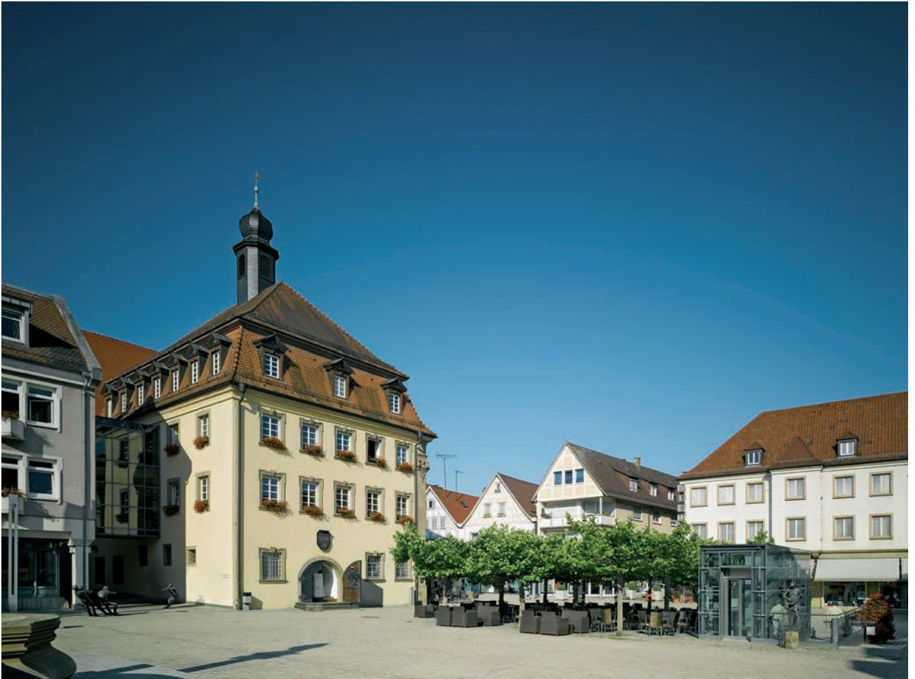
Marktplatz mit Rathaus