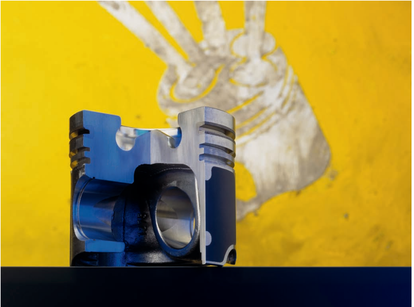
KSPG AG – LKW-Kolben