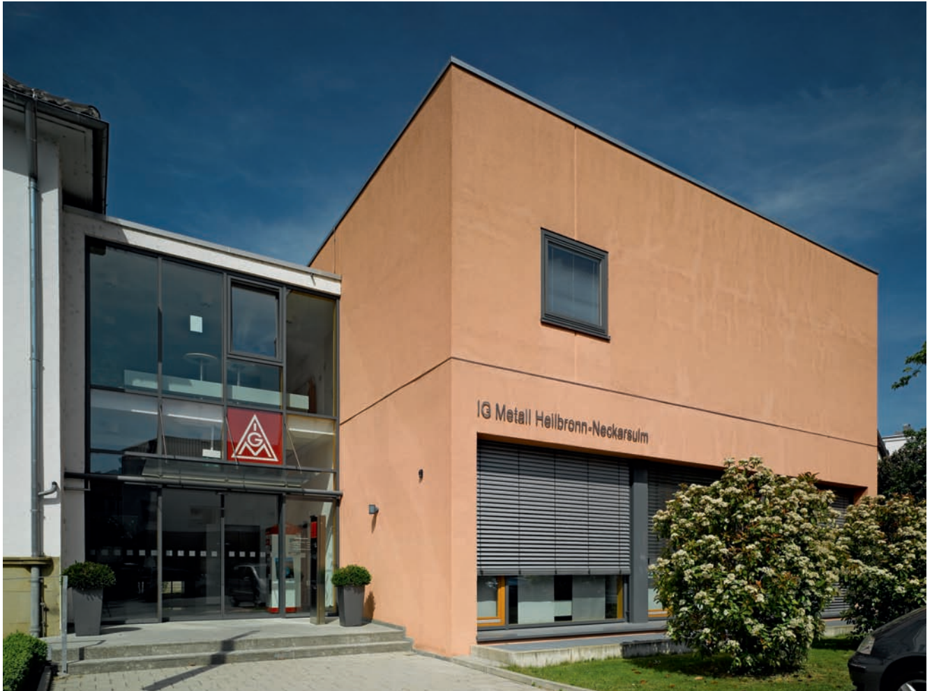
IG Metall Heilbronn-Neckarsulm