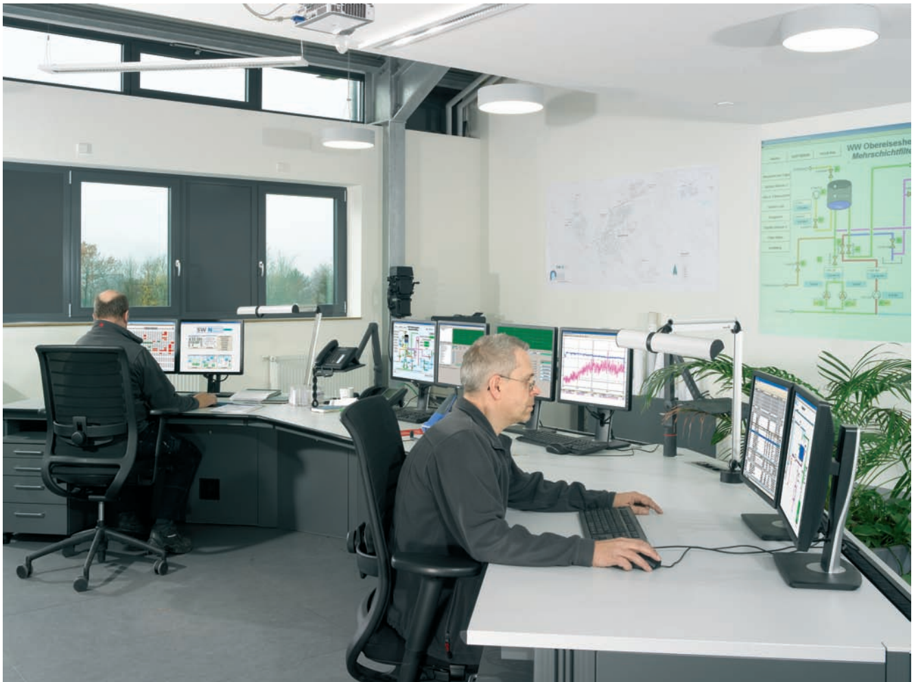
Techniker bei der Kontrolle Stadtwerke Neckarsulm