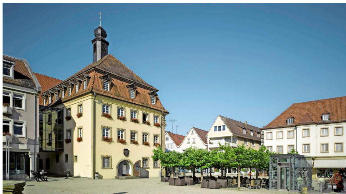
Neben Aufnahmen aus Kommunen wie Neckarsulm sollen in dem Buch auch Themen wie Wein, Kultur, Geschichte, Leben und Arbeiten sowie Bildung, Forschung und Institutionen behandelt und dargestellt werden.