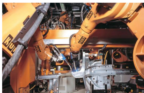
Auch Wirtschaftsunternehmen werden abgelichtet – zum Beispiel ein Roboter bei der Arbeit im Audi-Werk.